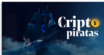
Podcast TC Investimentos