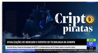
Podcast TC Investimentos