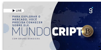
Podcast Genial Investimentos