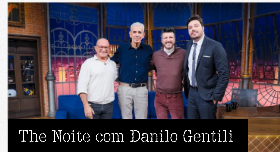
The Noite com Danilo Gentili